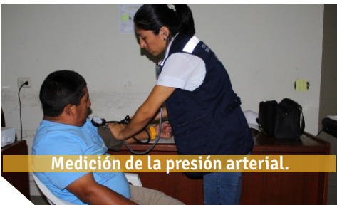
Medición de la presión arterial.