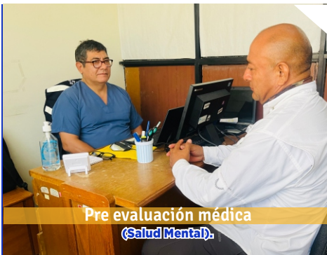
Pre evaluación médica (Salud Mental).